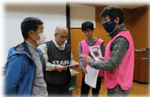
↑災害ボランティアセンター立上訓練の様子