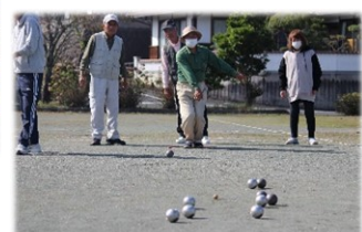
↓健康パタンク大会の様子