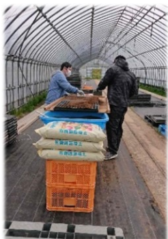
←えごまの苗植えの様子