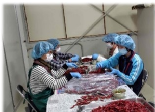
↓唐辛子のヘタ取りの様子