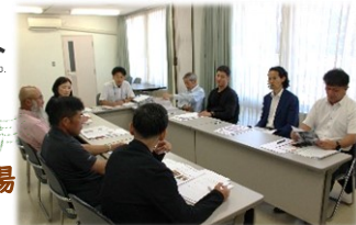
↑ネットワーク会議の様子