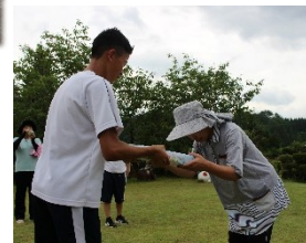
↓GG大会手伝いの様子