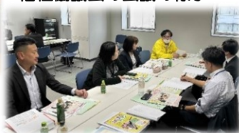
↓中国山地県境4市町社会福祉協議会の会議の様子