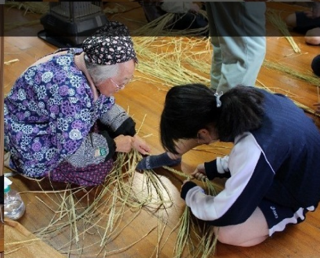
アコ基金50周年記念式典

平成17年仁多町社会福祉協議会と横田町社会福祉協議会が合併し、「奥出雲町社会福祉協議会」が発足しました。今年、創立から20周年を迎えました。