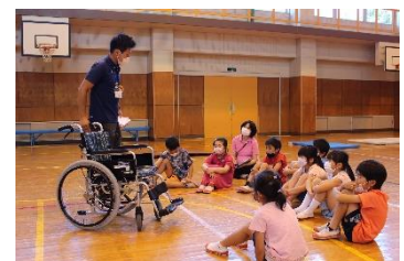
障がいに関する理解促進