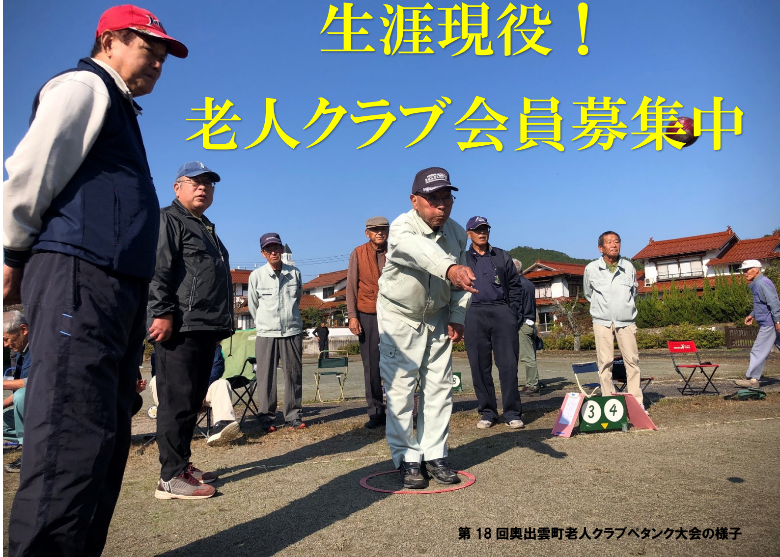
第18回奥出雲町老人クラブベタンク大会の様子