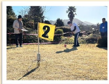
参加者と一緒にプレーもしました♪