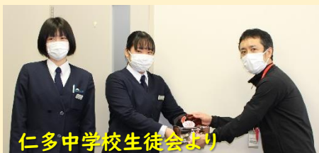
仁多中学校生徒会より

※お寄せいただいた募金は、 約 70%が奥出雲町の地域福祉に、30%が島根県内の福祉課題に活用されます。