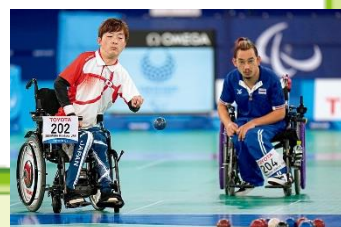
東京2020パラリンピック